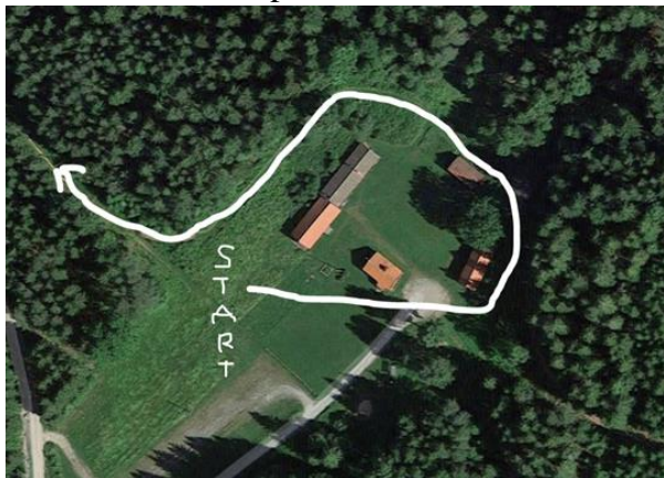
Figur 1: Starten är ungefär på den platsen som bilden visar