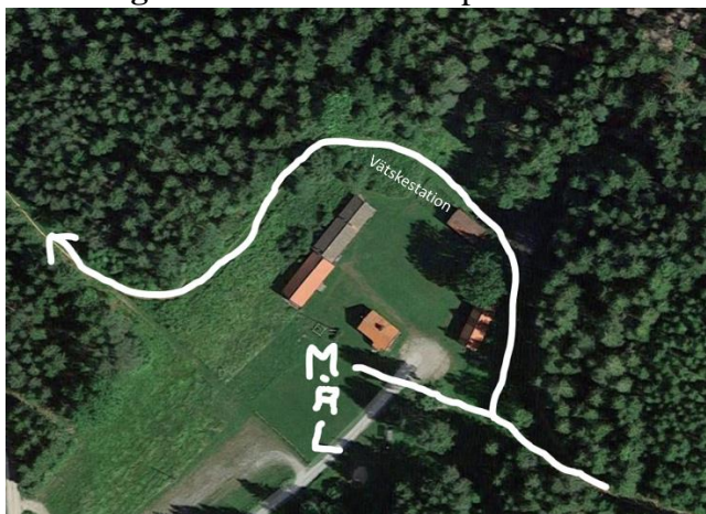
Figur 2: Målet är rakt fram, varvning till höger och vätskekontrollen är en bit in på nästa varv (nära från målet). Grillen kan man lukta sig till. 😊

Banmarkering: Snitslar kommer att finnas längs banan.